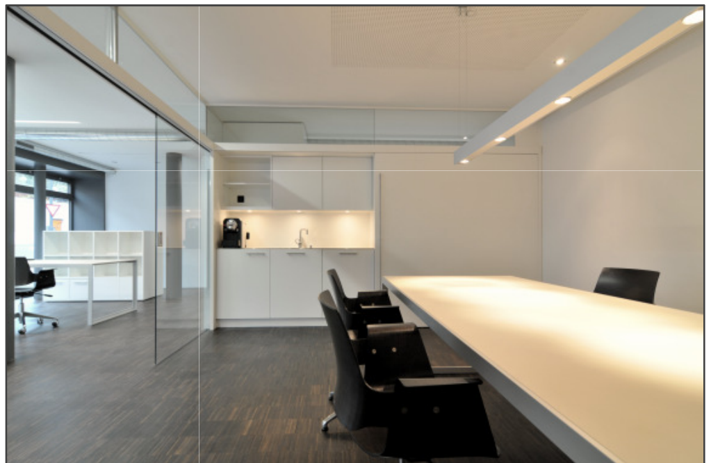
Konferenzraum mit Kaffeeküche