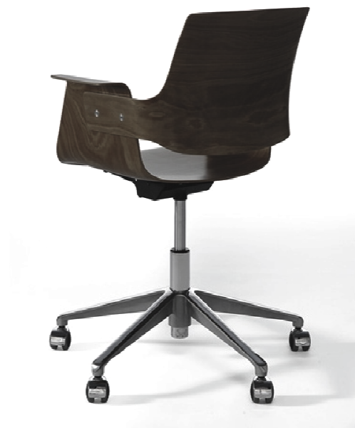
Marchand Atelier Chair

Die offene Bürostruktur mit einem Besprechungsraum ermöglicht, sich bei Bedarf unkompliziert auszutauschen oder in Arbeitsgruppen gemeinsam an Projekten zu arbeiten.